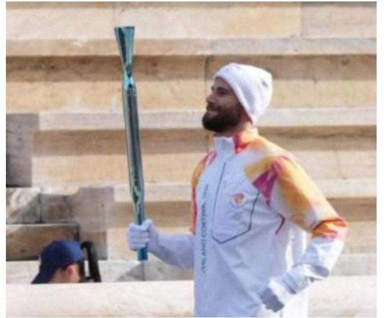
Olimpionico Il ciclista Filippo Ganna con la torcia allo Stadio Panathinaiko di Atene