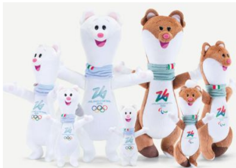
Iconici Gli ermellini Tina e Milo sono le mascotte dei Giochi di Milano Cortina 2026

La parte più «corposa» di tutto il merchandise è ovviamente quella dell'abbigliamento. Le collezioni più esclusive sono quelle sviluppate in collaborazione con Salomon e Armani, sponsor dei Giochi e partner ufficiali del