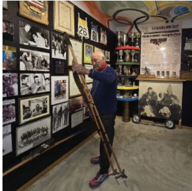
Museo Franco Nones nel suo Hotel Olimpionico tra affascinanti cimeli

« L o sci di fondo in Italia è nato nel 1968 a Grenoble. Da quel momento, uno sport praticato quasi solo nei Paesi Scandinavi, che messi insieme contano poco più della popolazione della Lombardia, ha superato i propri confini, conquistando la Val di Fiemme, il Trentino e, via via, tutto il nostro Paese. Il 7 febbraio, con il pettorale 26, ho vinto la 30 km olimpica e, per un curioso caso, la prima gara olimpica in Val di Fiemme andrà in scena proprio il 7 febbraio 2026». Anche chi non crede alle coincidenze non può che augurarsi che queste cifre portino fortuna all'Italia dello sci di fondo: sono infatti i numeri di Franco Nones , leggenda di questo sport e primo azzurro a conquistare una medaglia olimpica nella specialità, in mezzo a un "esercito" di atleti scandinavi e sovietici, arrivando sul traguardo con 50 secondi di vantaggio sugli avversari. Nones, oggi ottantacinquenne in ottima forma, ha appena pubblicato «Il primo oro», un libro in cui, con il supporto dell'amico Pino Dellasega, ripercorre una vita straordinaria. E basta aprire la porta del suo negozio di articoli sportivi a Castello di Fiemme per ritrovarsi davanti le scarpe, gli sci e i