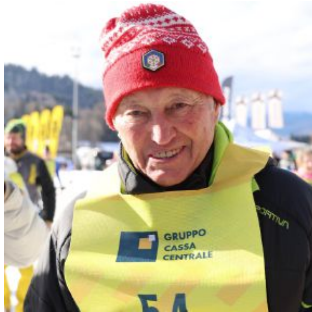
Marcialonga Il fiemmesese al via della «Stars», manifestazione benefica