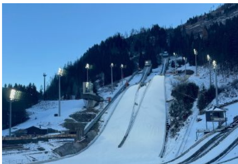
Salto Il rinnovatissimo Ski Jumping Stadium di Predazzo, con i due trampolini Hs 134 e Hs 106

combinata nordica. Fra le sei giornate di gara previste, tutte in orario serale fra le 18.45 e le 19, alcune hanno ancora a disposizione solo i biglietti più «esclusivi». Sabato 7 febbraio si comincia con la finale del trampolino piccolo femminile, gara maschile prevista invece lunedì 9. Il giorno dopo è la data della gara a squadre, il weekend