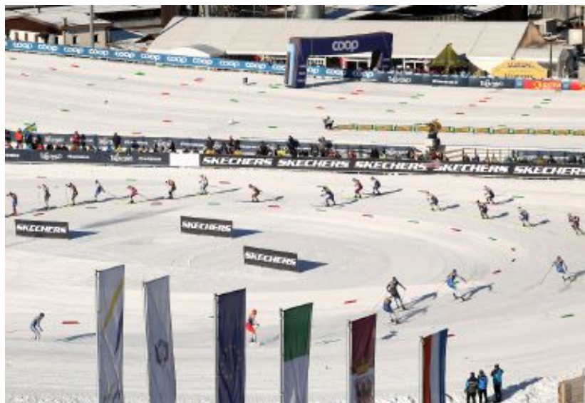
Fondo Lo stadio del Fondo di Lago di Tesero, arena delle gare sugli sci stretti e del para biathlon

Disponibilità agli sgoccioli in quel di Predazzo, dove si trova lo Ski Jumping Stadium che ospiterà le gare di salto con gli sci e la relativa parte di