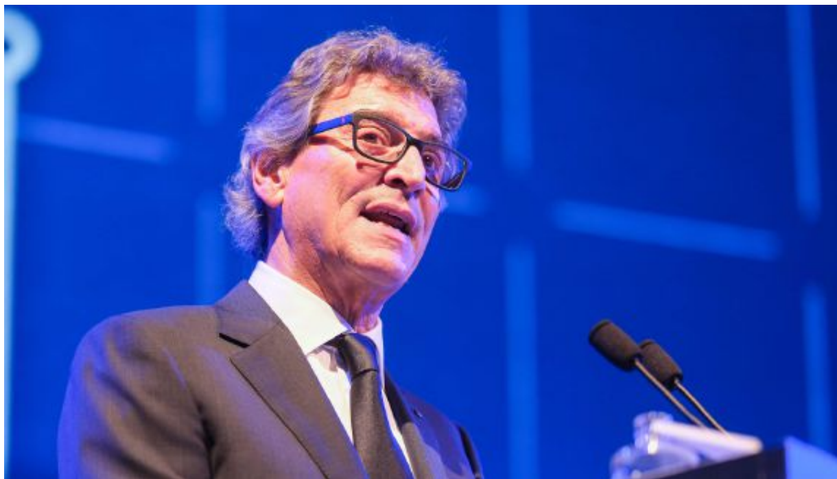
Presidente Lorenzo Delladio, alla guida di Confindustria Trento, nonché presidente e amministratore delegato dell'azienda La Sportiva