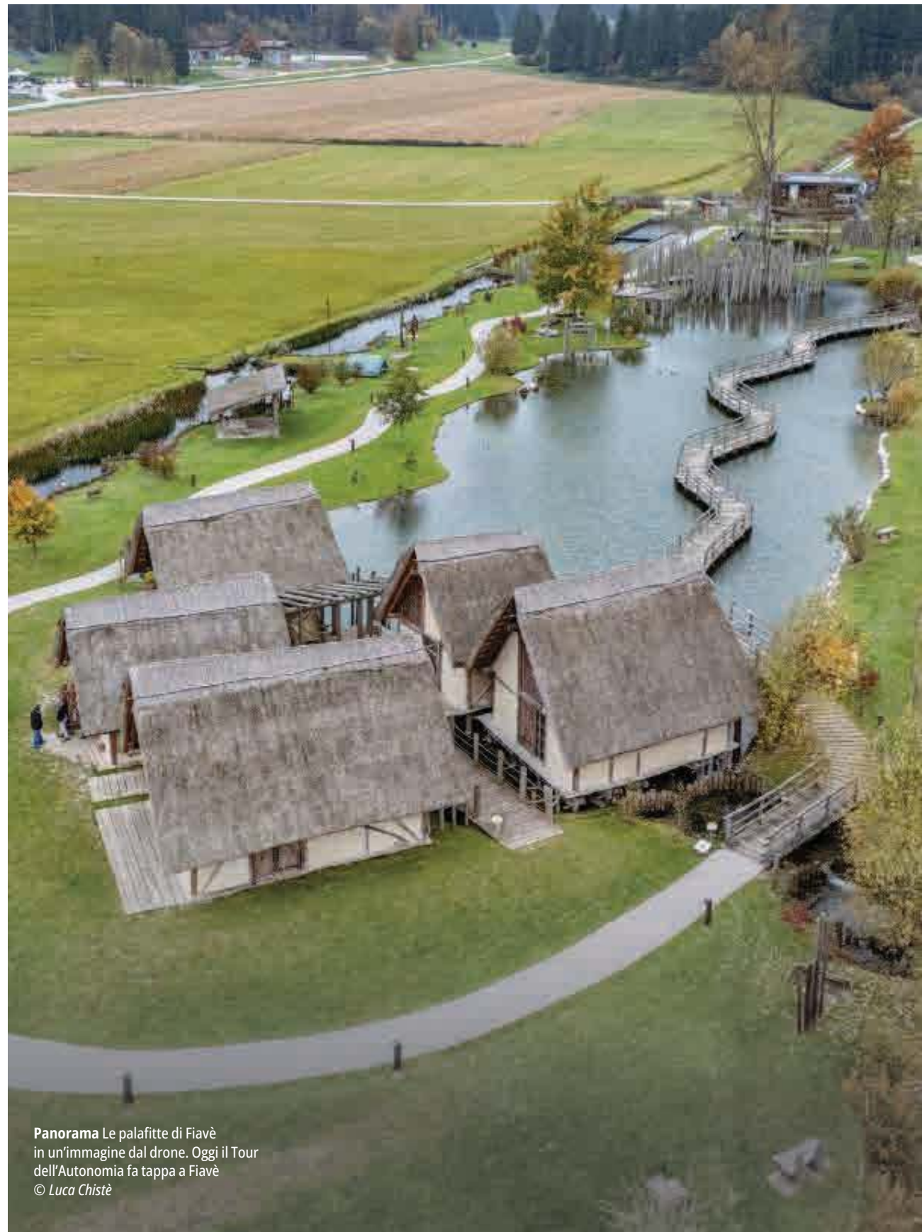
Panorama Le palafitte di Fiauvé in un'immagine dal drone. Oggi il Tour dell'Autonomia fa tappa a Fiauvé