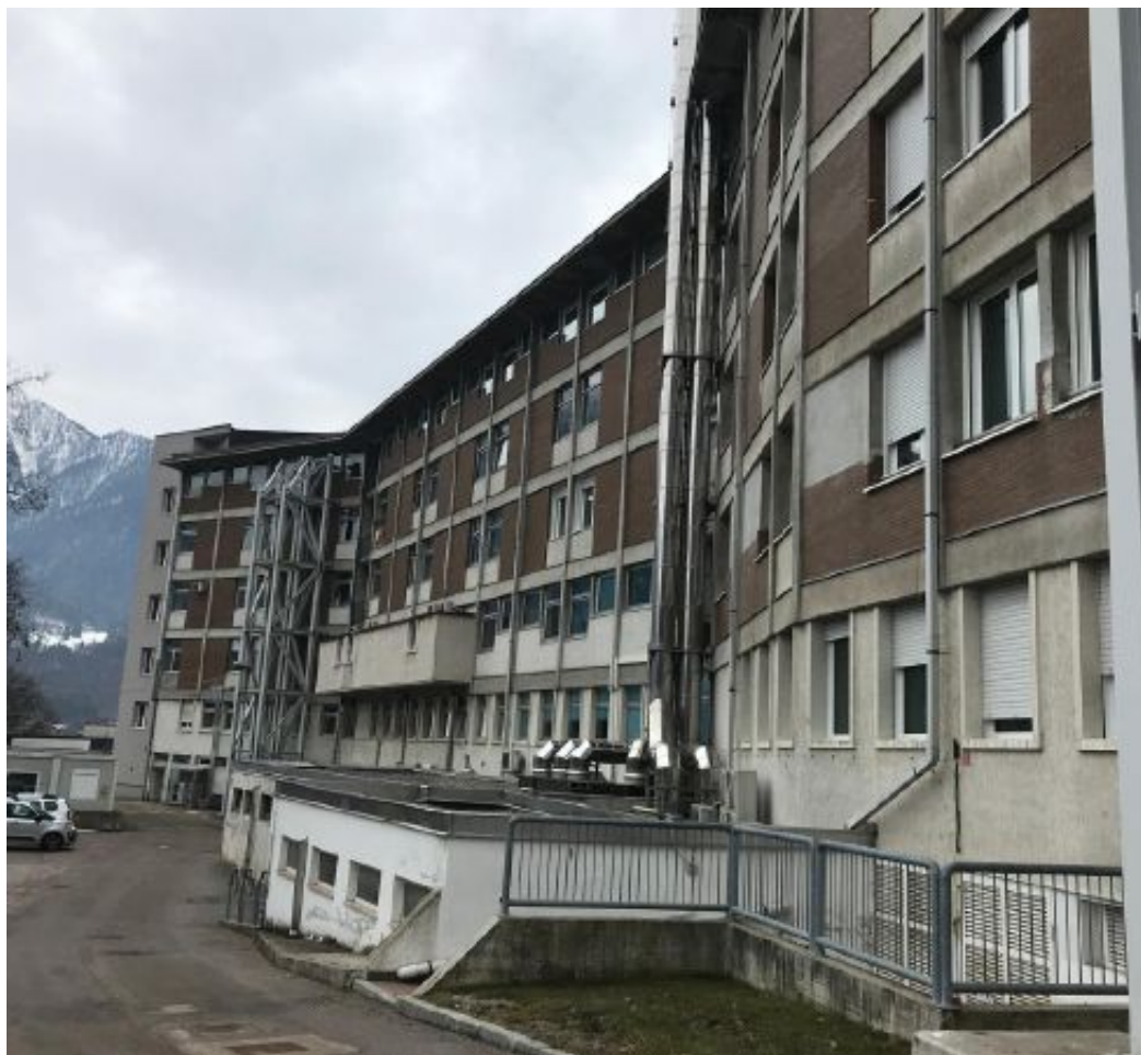
Ospedale Il nosocomio di Tione, capoluogo delle valli Giudicarie