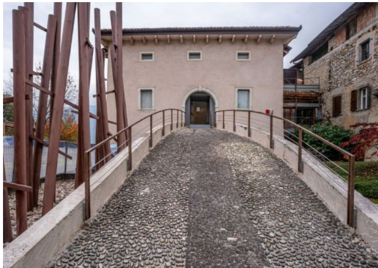
Museo delle Palafitte Oggi ospiterà alcuni degli eventi del Tour dell'Autonomia a Fiavé